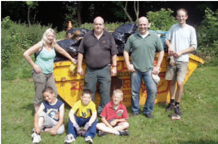
Gweithiodd Cyngor Tref Cas-gwent gyda gwirfoddolwyr a grwpiau cymunedol lleol i godi sbwriel yn y coetir lleol.

I ddechrau, byddwch yn dilyn yr un arddull â'ch rhagflaenydd, ond os ydych yn gweld bod angen gwneud newidiadau, cyflwynwch nhw'n bwyllog ar gyflymder sy'n addas ar gyfer eich cyngor. Nid yw unrhyw gyngor yn hoffi clywed eu bod wedi bod yn gwneud pethau'n anghywir, ond bydd yn dysgu'n fuan i wrando ar glerc pwylllog a gwybodys. Bydd hyfforddiant pellach yn eich helpu i wneud gwelliannau yn ôl yr angen.