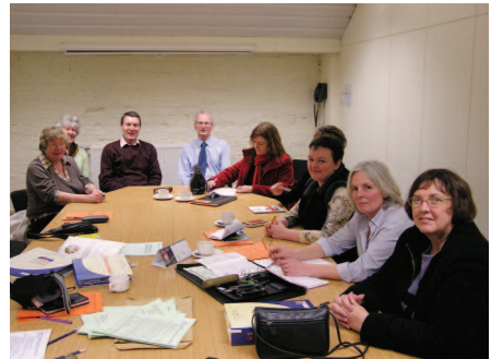
Grŵp o glercod yn cael eu cyflwyno i Cydweithio â'ch Cyngor

Clercod Cynghorau Lleol i glercod newydd o'r enw Cydweithio â'ch Cyngor , a luniwyd gan Brifysgol Swydd Gaerloyw gyda gwybodaeth ategol i Gymru gan Brifysgol Cymru Aberystwyth. Gall y cwrs hwn gael ei gefnogi'n lleol gan fentor (un-i-un) neu gan hwylusydd sy'n cynnal grŵp. Mae Cymdeithas Clercod Cynghorau Lleol hefyd yn cynnal grwpiau e-drafod â thiwtor ar gyfer y cwrs hwn, un ar gyfer Cymru ac un arall ar gyfer Lloegr. Mae manylion ar gael gan swyddfa Cymdeithas Clercod Cynghorau Lleol yn Taunton (01823 253646) neu ar y wefan www.slcc.co.uk .