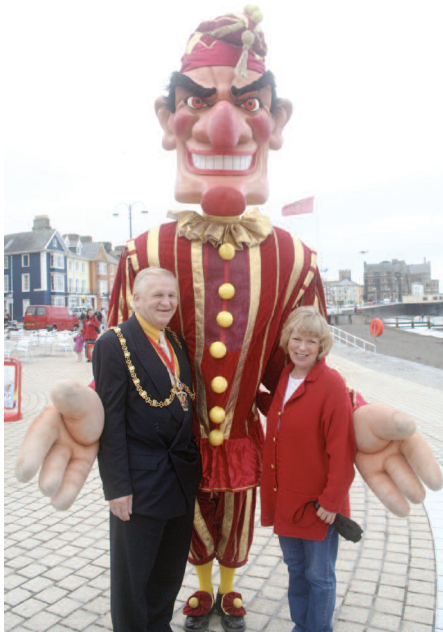
Yr Ŵyl Pwnsh a Jwdi flynyddol a gefnogir ac a ariennir gan Gyngor Tref Aberystwyth

Mae Swyddog Mentora Cymdeithas Clercod Cynghorau Lleol wedi darparu deunyddiau ar gyfer y llyfryn hwn, gyda help a chymorth llawer o glercod a thîm ymgynghorol Cymdeithas Clercod Cynghorau Lleol. Bydd Cymdeithas Clercod Cynghorau Lleol a'i phartneriaid bob amser ar gael i gynnig cymorth. Y cwbl sydd angen i chi ei wneud yw gofyn.