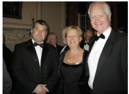
Clercod Cymru yn rhwydweithio ac yn mwynhau derbyniad nos yng Nghynhadledd Genedlaethol flynyddol Cymdeithas Clercod Cynghorau Lleol

Yn y cyfamser, rydym yn siŵr y bydd y gwaith yn arbennig o ddiddorol o ran ei amrywiaeth. Cofiwch nad ydych ar eich pen eich hun. Mae llawer o bobl yn barod i'ch helpu. Yn y rhan nesaf, bydd llawer o glercod a oedd yn gweithio adeg ysgrifennu'r llyfryn hwn yn siarad gyda chi'n uniongyrchol am eu gwaith. Maent yn awgrymu'r hyn y bydden nhw wedi hoffi ei wybod pan oeddent yn eich sefyllfa chi, ar ddechrau'r daith fel clerc i gyngor lleol.